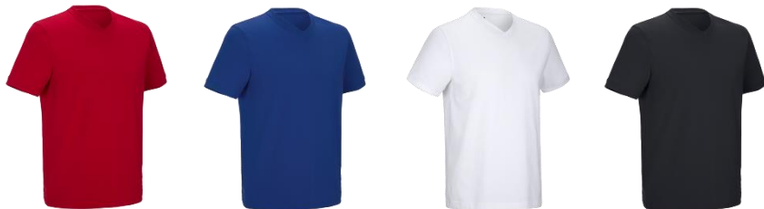
e.s. T-shirt cotton stretch V-Neck