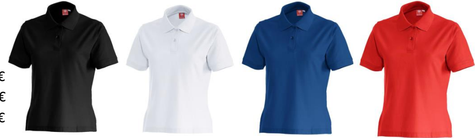
e.s. Polo-Shirt cotton, Damen