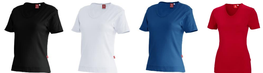
e.s. T-Shirt cotton V-Neck, Damen