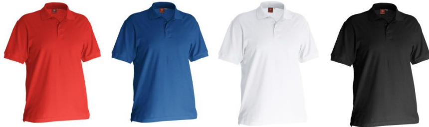
e.s. Polo-Shirt cotton