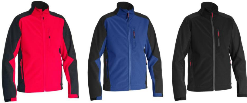
Softshell Jacke dryplexx® softlight