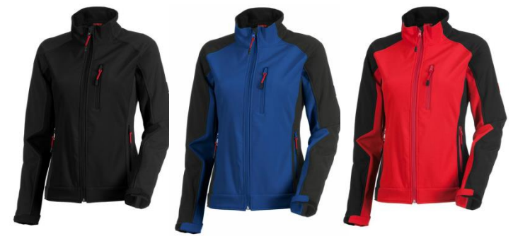
Damen Softshelljacke dryplexx® softlight